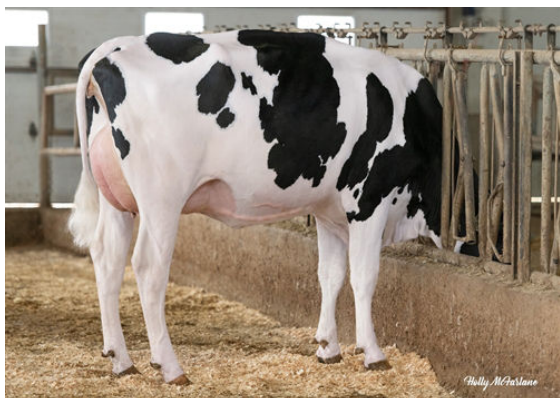
PROGENESIS LUGNUT NEW MOON DAUGHTER