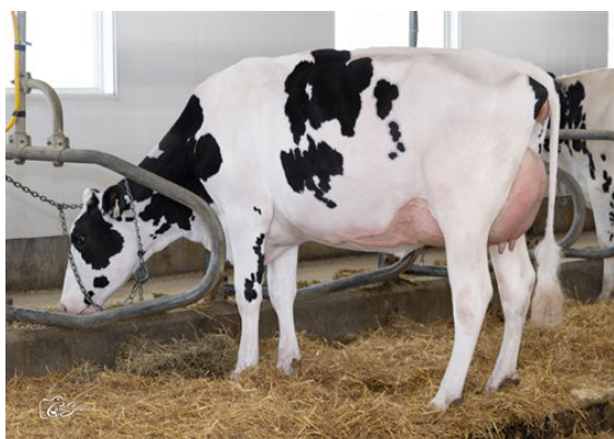
DUBENOIT LUGNUT KATE DAUGHTER