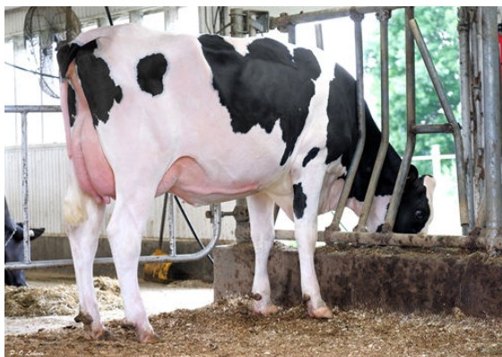
BOFRAN LUGNUT FRIGGY DAUGHTER